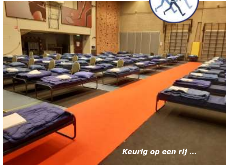
Keurig op een rij ...

De stand wordt bezet door circa 10 medewerkers, die verschillende taken hebben.