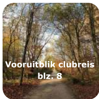
Vooruitblik clubreis blz. 8