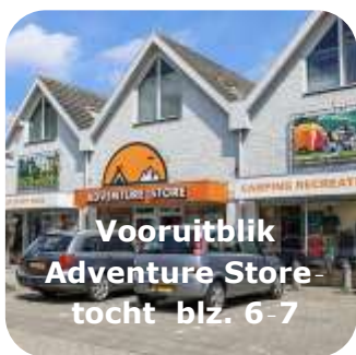
Vooruitblik Adventure Store- tocht blz. 6-7