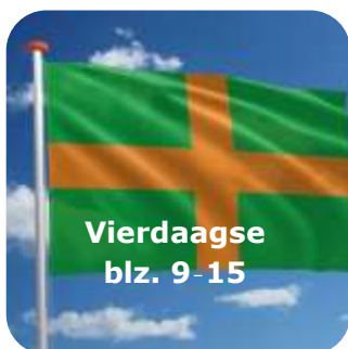
Vierdaagse blz. 9-15