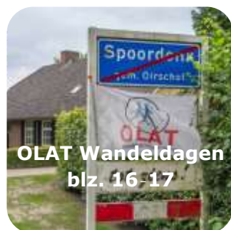
OLAT Wandeldagen blz. 16-17